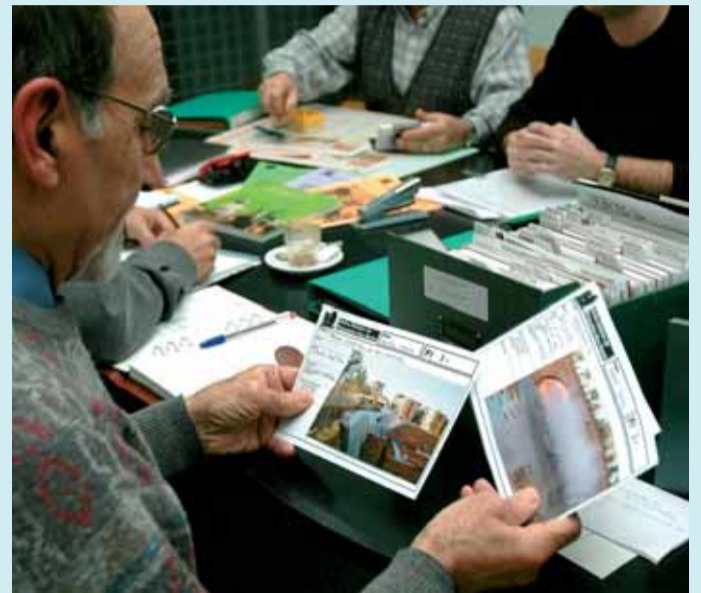
L'arxiu té plànols dels anys 50, unes 300 capçaleres de revistes i articles sobre Nou Barris.

També s'hi poden consultar més de 300 capçaleres de revistes i tots els articles originals sobre Nou Barris apareguts a partir de 1984 (n'hi ha d'abans, però en fotocòpies), així com entre 10.000 i 12.000 cartells de diferents èpoques, entre els quals destaquen els de la