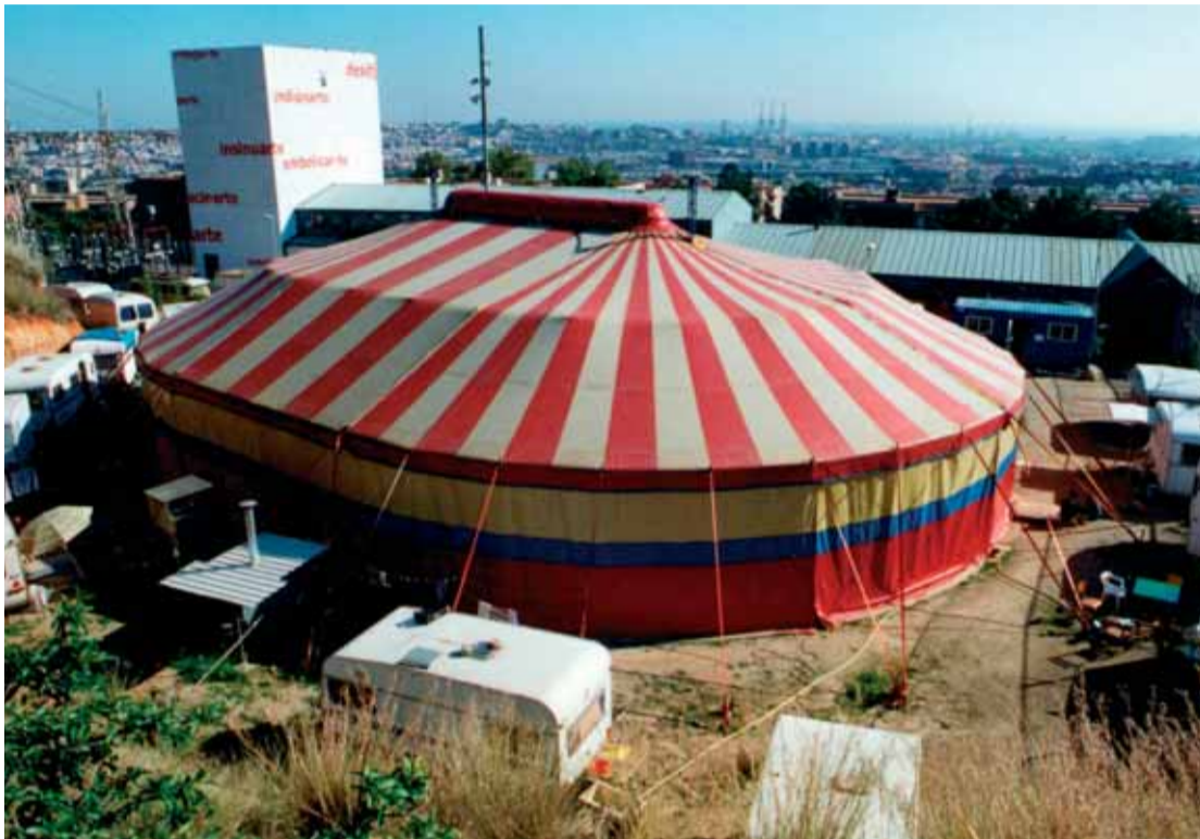
La carpa de circ forma part de l'aspecte habitual de l'Ateneu.

L'Ateneu Popular Nou Barris es prepara per fer un salt endavant amb una oficina de producció de circ, l'ampliació d'espais i la recerca d'un nou model de gestió