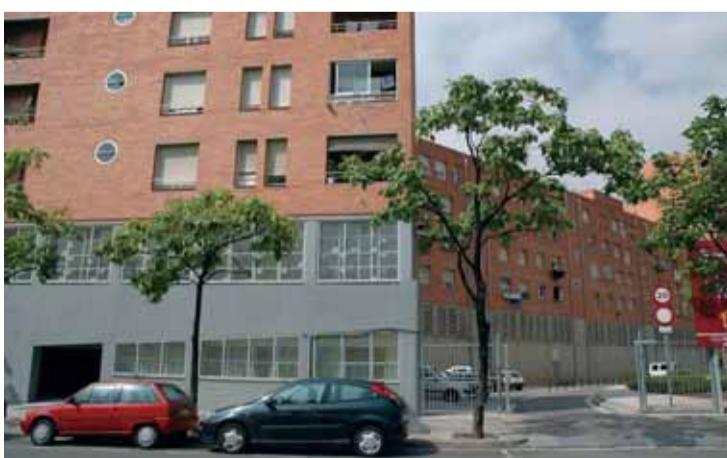
Seu dels Mossos d'Esquadra al passeig Andreu Nin, 59.

En el moment de tancar aquesta edició, les noves dependències dels Mossos d'Esquadra, situades al número 59 del passeig d'Andreu Nin, estaven a pocs dies d'entrar en servei com a segon comandament del desplegament de la policia autonòmica a la ciutat. Això vol dir que bona part dels agents que es vagin incorporant durant els propers mesos al control de la seguretat a tota la ciutat tindran la