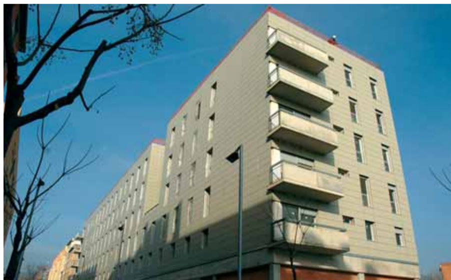
Aquest és el nou edifici on viuran 42 de les famílies reallotjades.

Els habitants de l'illa compresa pels carrers Sant Iscle, Montsant i Inca, al barri del Turó de la Peira, van haver ser reallotjats a causa de la situació de ruïna imminent que va afectar tres de les finques de l'illa. En la fase final de l'obra de rehabilitació del clavegueram del carrer Sant Iscle, s'havia produït el trencament d'una canonada d'aigua potable que va provocar un arrossegament de terres i va afectar la cimentació de l'edifici. Per tal d'atendre les peticions d'informació per part dels veïns afectats, des del passat 24 de gener, funciona una oficina d'informació habilitada per l'Ajuntament al Centre Cívic les Basses (c/ Teide, 20).