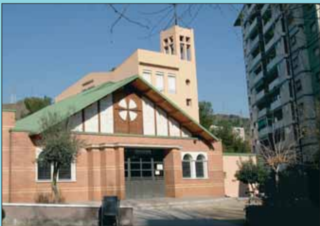
Ara Amb la nova edificació, l'antiga construcció ha quedat plenament integrada dins de la nova església.