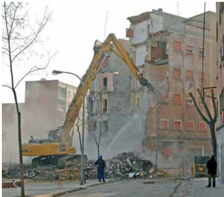
Després del moviment de terres va caldre enderrocar.

Els habitatges es trobaven situats a la illa "Q" del Turó de la Peira i ja estava previst enderrocar-los a causa de la seva afectació estructural per aluminosi, d'acord amb el Pla Especial de Reforma Interior per a la remodelació de cinc illes al Turó de la Peira. Després d'un primer desallotjament urgent dels ocupants de les finques més afectades, l'Ajuntament va procedir a realitzar el desallotjament de tota la resta d'edificis de l'illa com a mesura preventiva. Als veïns i veïnes se'ls va oferir allotja-