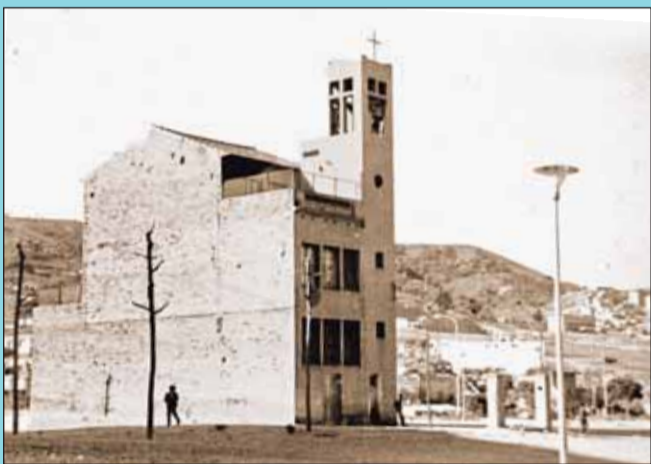
Abans Imatge d'una isolada església, probablement del començament dels anys seixanta.