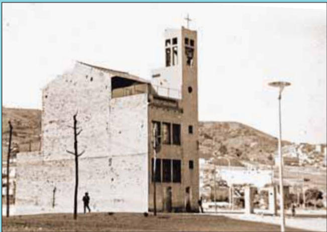
Abans Imatge d'una isolada església, probablement del començament dels anys seixanta.