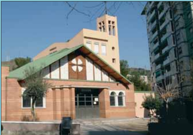
Ara Amb la nova edificació, l'antiga construcció ha quedat plenament integrada dins de la nova església.