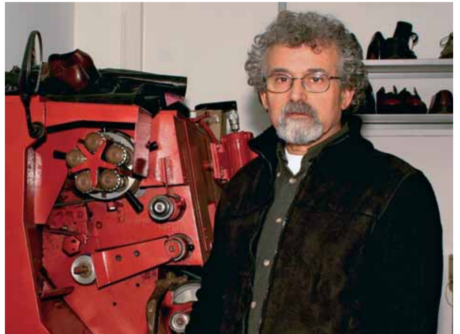
Silva lidera l'Associació de Veïns i té el seu taller al barri.

siempre que la administración va muy lenta y que los edificios ya tendrían que haber sido sustituidos y nos habríamos ahorrado toda esta situación. Regesa, que es la empresa que hace las reparaciones, tiene que espabilar.