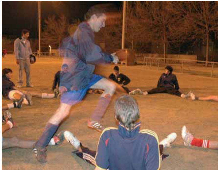
El club i el Districte han arribat a un acord per fer el nou camp.

Després d'arribar a un acord amb el Districte, el nou camp i les noves instal·lacions, situats en uns terrenys adients i dintre del barri, podran acollir tots els infants i joves del barri que vulguin jugar a futbol. A més, "gràcies a l'augment del nombre de nois dels