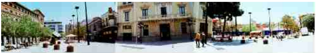
Imatge i Montatge: Alicia Roselló